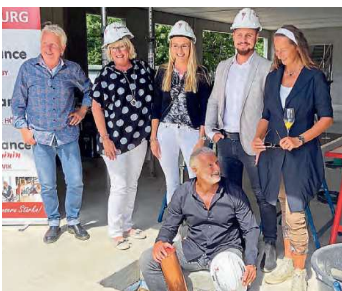
Die Grundsteinlegung des „balance Westliche Höhe“.